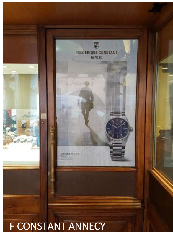
F CONSTANT ANNECY

Résistant pour environ 6 mois. Se pose sur des supports en verre. Laisse passer la lumière et permet de garder une luminosité dans l'espace de vente. Nécessite une pose par un professionnel.