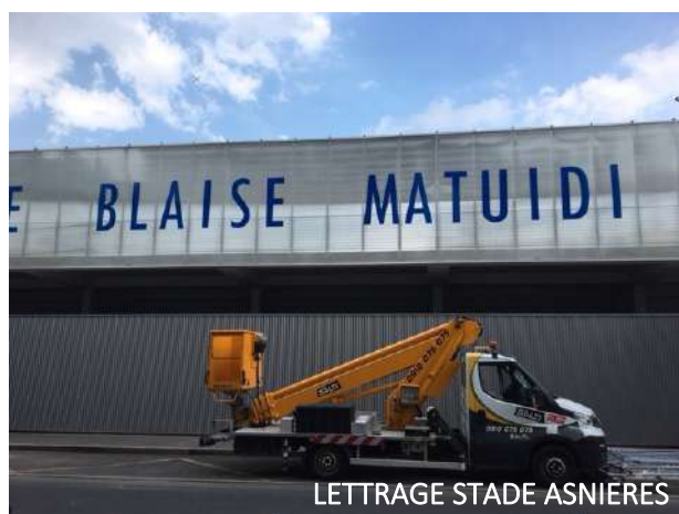
LETTRAGE STADE ASNIERES