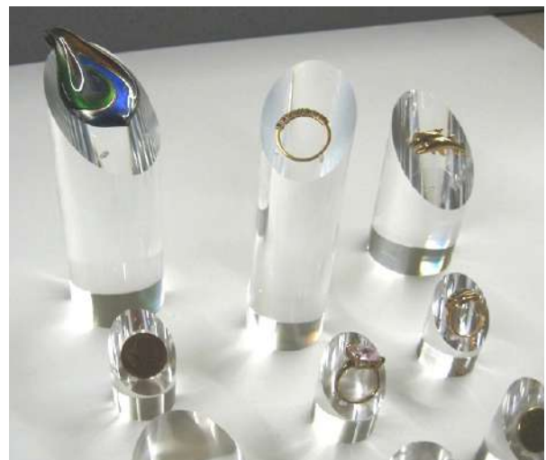
PRESENTOIR POUR BAGUES SUR MESURE