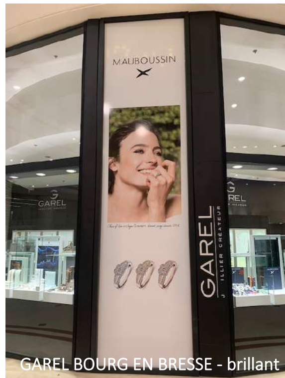
GAREL BOURG EN BRESSE - brillant