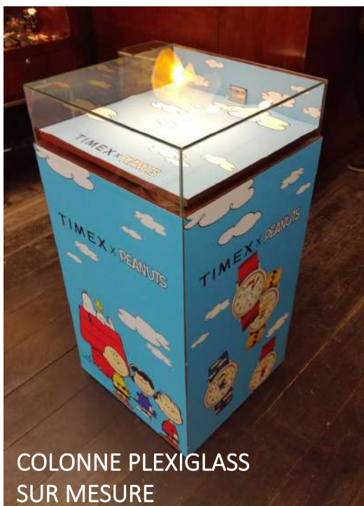
COLONNE PLEXIGLASS SUR MESURE