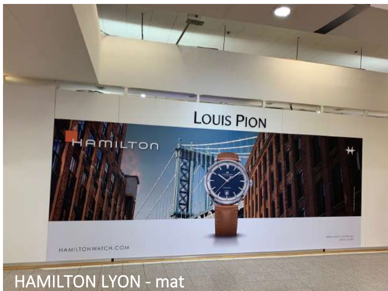
HAMILTON LYON - mat