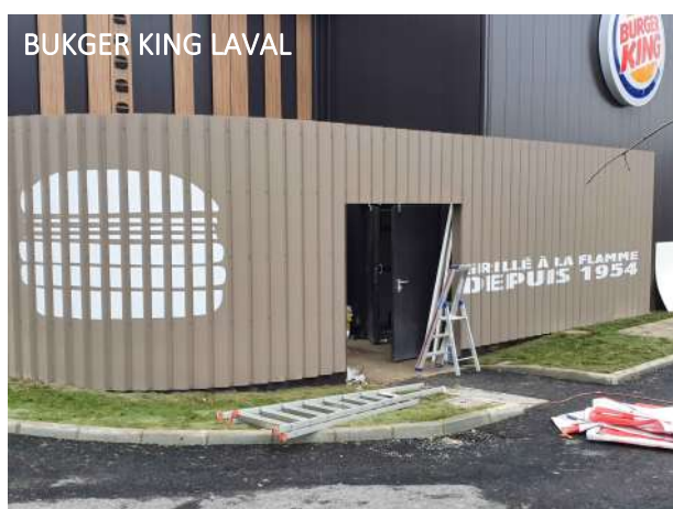
BUKGER KING LAVAL