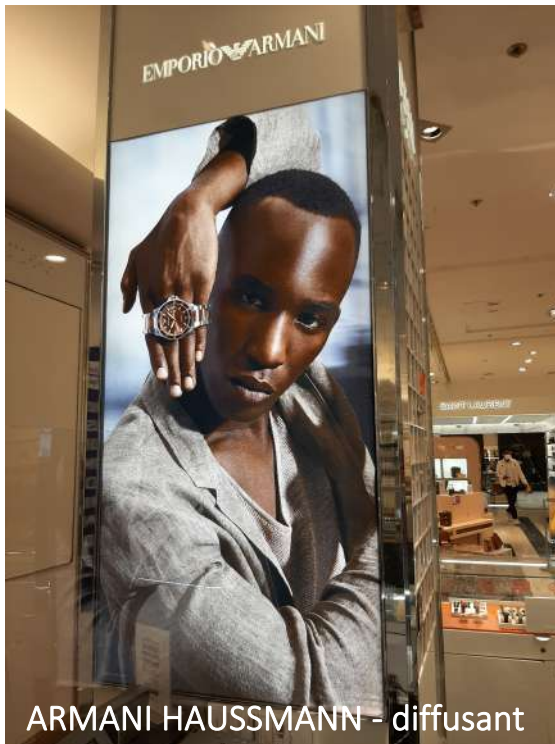
ARMANI HAUSSMANN - diffusant

Produit à forte technicité lors de la prise de côte et de la pose. Le support a une technique de pose bien particulière mais peut être posé par le client selon le format de la toile.