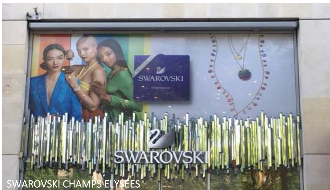
SWAROVSKI CHAMPS ELYSÉES